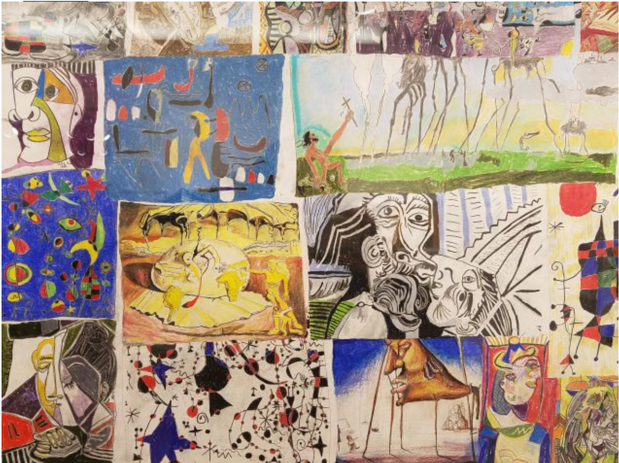
Une œuvre au crayon de couleurs par Nicole Appel exposée par la galerie LAND. Scott Indrisek

C'est une semaine importante pour les outsiders, les vrais et les autres.