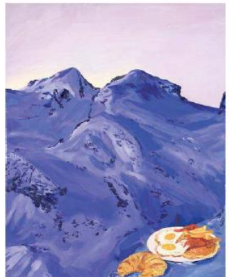
4. Hotel breakfast with croissants in the high Himalaya , Karen Kilbrink, 2008. Exposé à la FIAC

3. Angelo Soliman , Omar Victor Diop, 2014. Exposé à Officielle