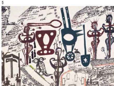
5. Quattro crocifissi, scodella e cucchiato, vellivolo, carricata, e vanga , Carlo Zinelli, 1971. © Carlo Zinelli, Courtesy David Morris Gallery, Exposé à l'Outsider Art Fair